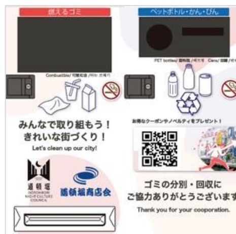
<設置する IoT ゴミ箱(ラッピングイメージ)>