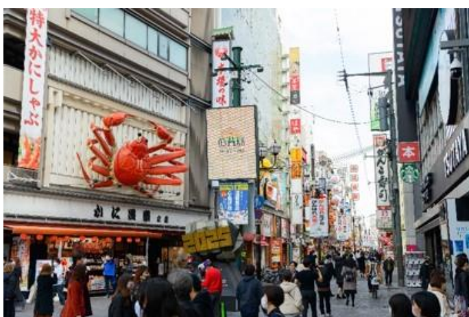
<道頓堀商店街>

https://dotonbori-night.com/news/2023/clean/